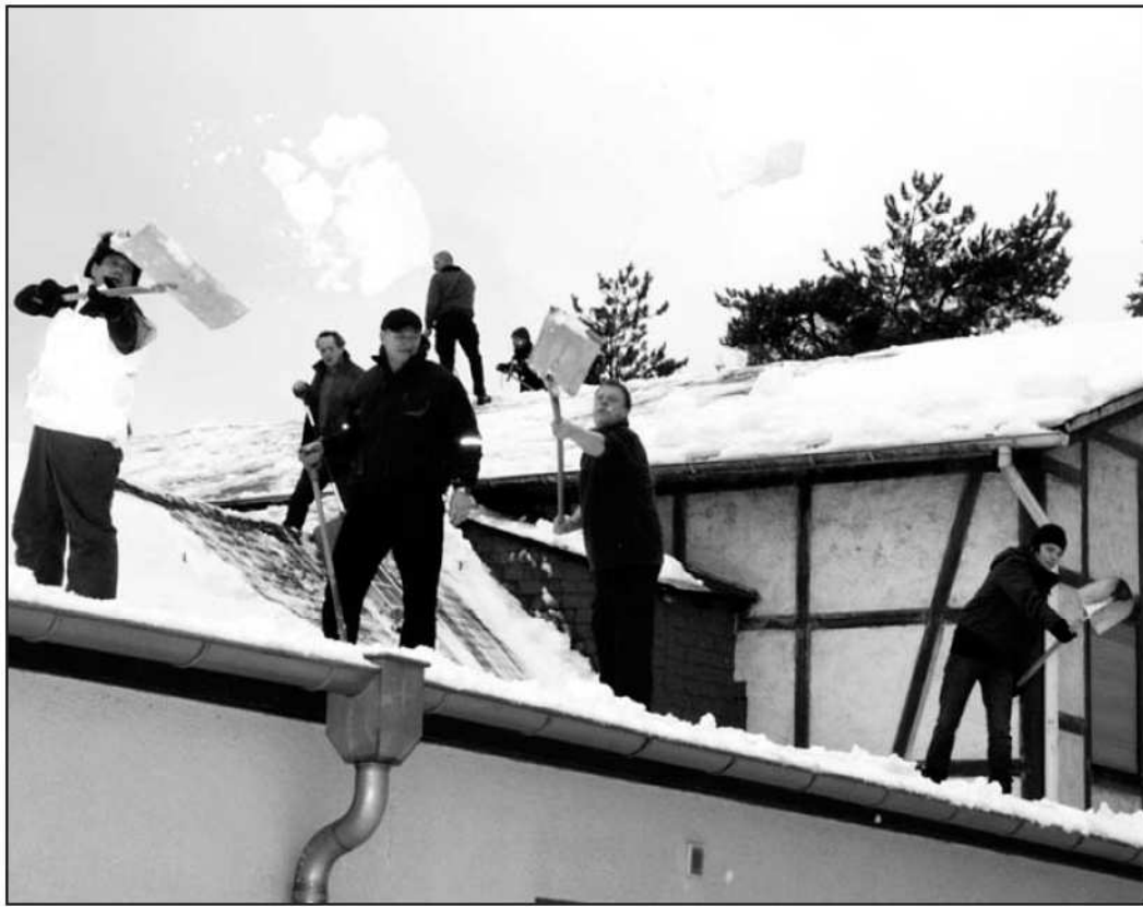
Es kamen viele Vereinsmitglieder und halfen den Schnee vom Dach und vom Parkplatz zu entfernen.